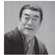
かんだしょうりゅう 神田松鯉

東京都出身。代表作にTV時代劇「木枯し紋次郎」がある。作家デビューは、東南アジア三部作。