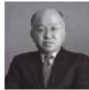
あさだじろう 浅田次郎

東京都出身。1997年「鉄道員」で直木賞受賞。多彩な作風で読者を魅了し、文学賞受賞多数。