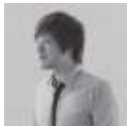
ひらの けいいちろう 平野啓一郎

北九州市出身。1987年「鍋の中」で芥川賞受賞。ほか文学賞受賞多数。日本芸術院会員。