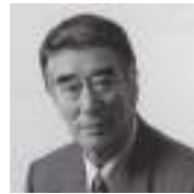
なかむらあつお 中村敦夫

脚本・演出：中村敦夫 (俳優・作家) 出演：神田松鯉 (講談師) 中井貴恵 (女優)