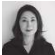
きりの なつお 桐野夏生

石川県出身。1999年「柔らかな頬」で直木賞受賞。ほか文学賞受賞多数。日本ペンクラブ会長。