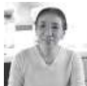
むらた きよこ 村田喜代子

石川県出身。1999年「柔らかな頬」で直木賞受賞。ほか文学賞受賞多数。日本ペンクラブ会長。