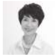
なかい きえ 中井貴恵

群馬県出身。1970年二代目神田山陽に入門。三代目神田松鯉襲名。人間国宝。旭日小綬章受章。