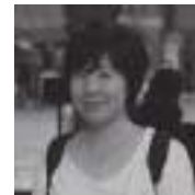
きむ ふな きむ ふな

中国河南省出身。1991年来日留学。城西国際大学客員教授。詩集「石の記憶」でH氏賞受賞ほか。