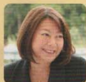
堂島スイーツ代表

デザートというよりも「おやつ」として家族で親しんで頂きたい。そんな思いを込めた堂島スイーツのお菓子。高度成長期真っただ中の昭和40年代。仕事に夢中で不在がちな父と私たち家族の絆だった「母の手作りプリン」。